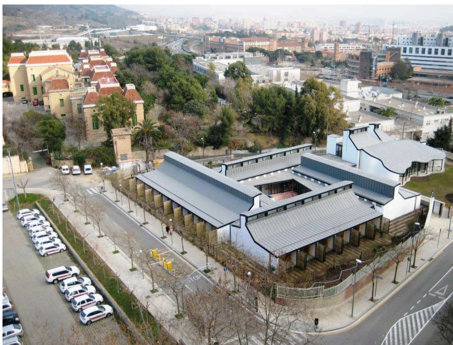
La "Casa dels Xuklis".

Fruit de les darreres edicions hem pogut dur a terme l'acondicionament del Servei d'oncohematologia de l'Hospital Maternoinfantil de la Vall d'Hebron, l'obertura de la delegació d'AFANOC a Tarragona i la seva ampliació, i hem finalitzat les obres de la Casa dels Xuklis.